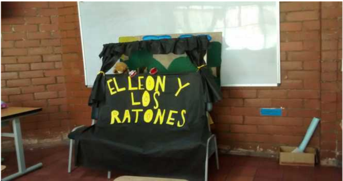
Anexo 7 obra de títeres el león y los ratones grupo5.1