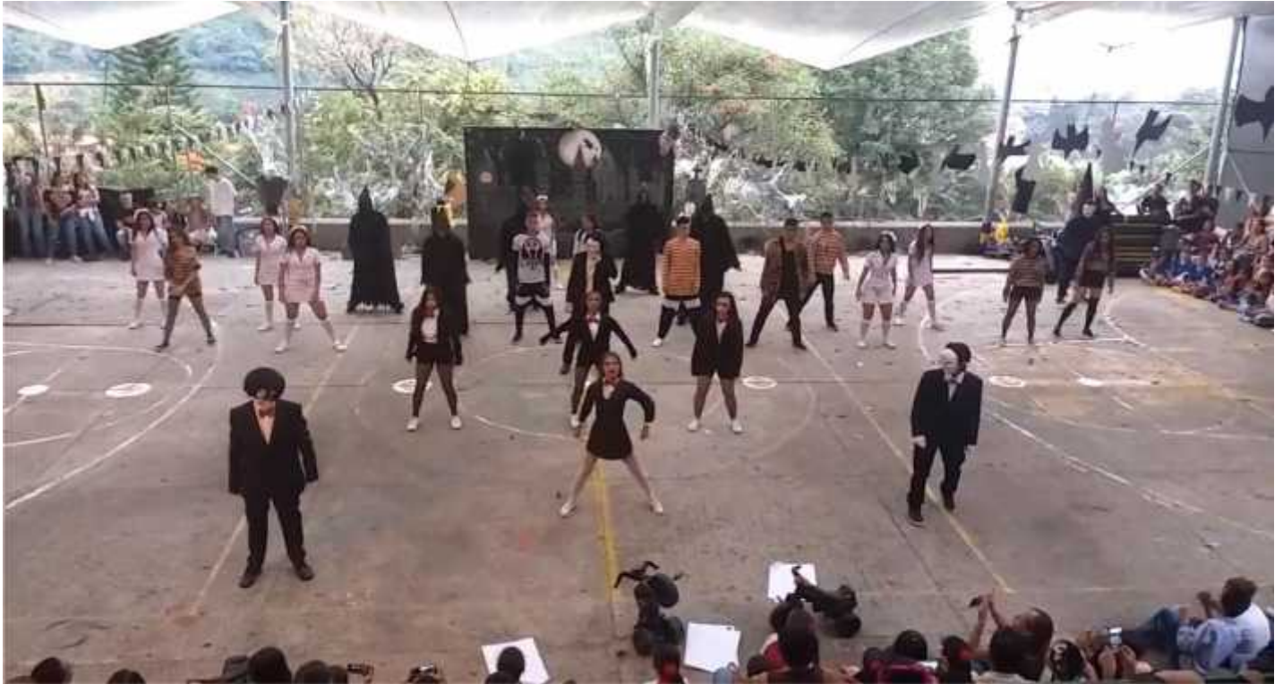
Anexo 4. Muestra de coreografías festival vive