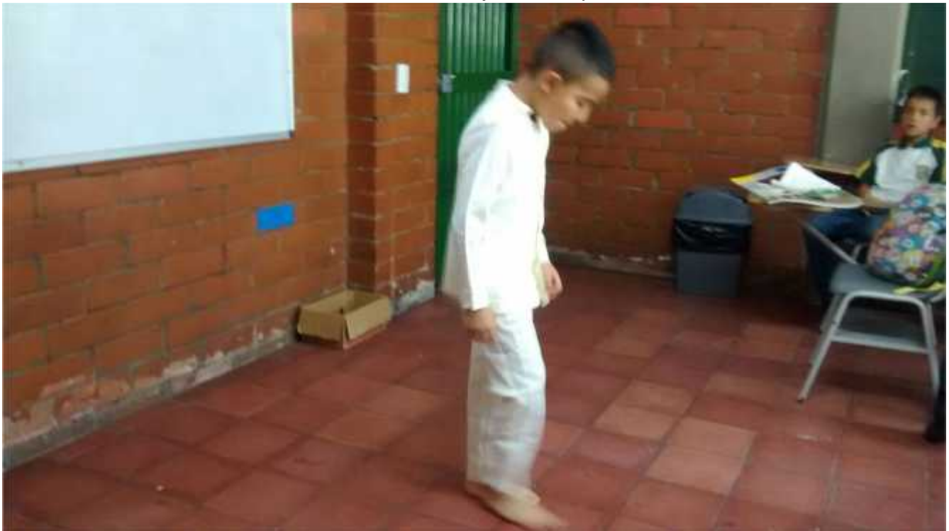
Anexo 10 Baile el Joropo grupo 3.2