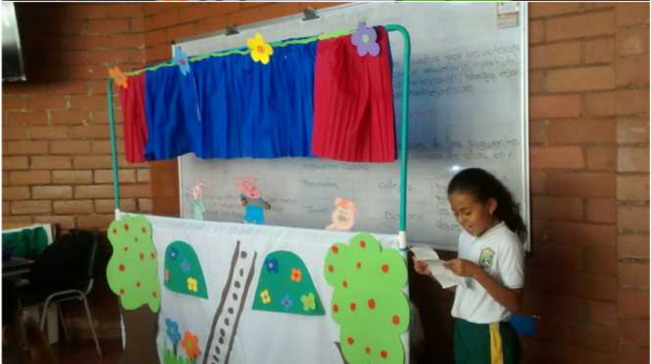
Anexo 5 Obra de títeres los tres cerditos Grupo 3.2