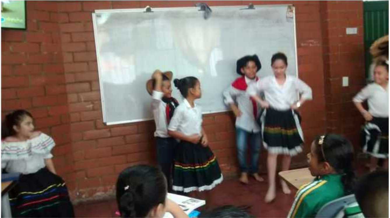
Anexo 9 Baile el Sanjuanero Grupo 4.2