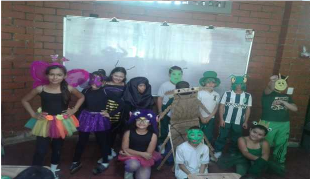
Anexo 11 obra de teatro La rana Lucy y el grillo Guillermo Grupo3.3