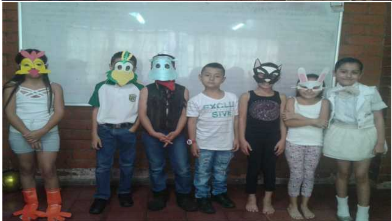
Anexo 12 Obra de teatro Despedida Escolar Grupo 3.3