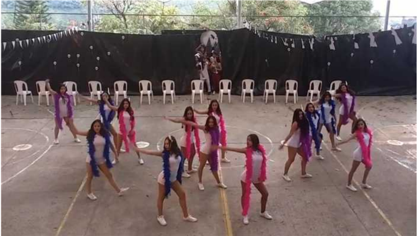
Anexo 3. Festival vive muestra de coreografías