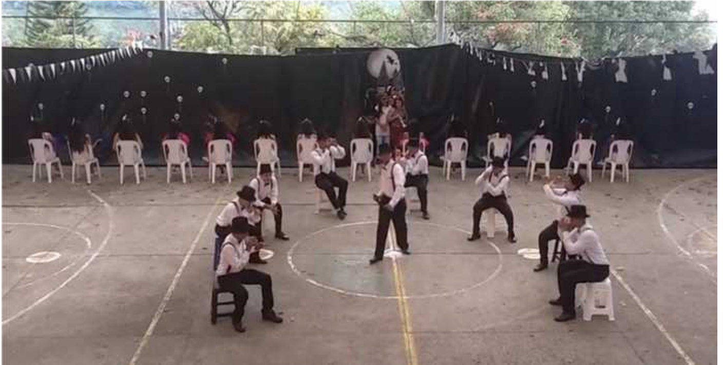
Anexo 2. Festival vive