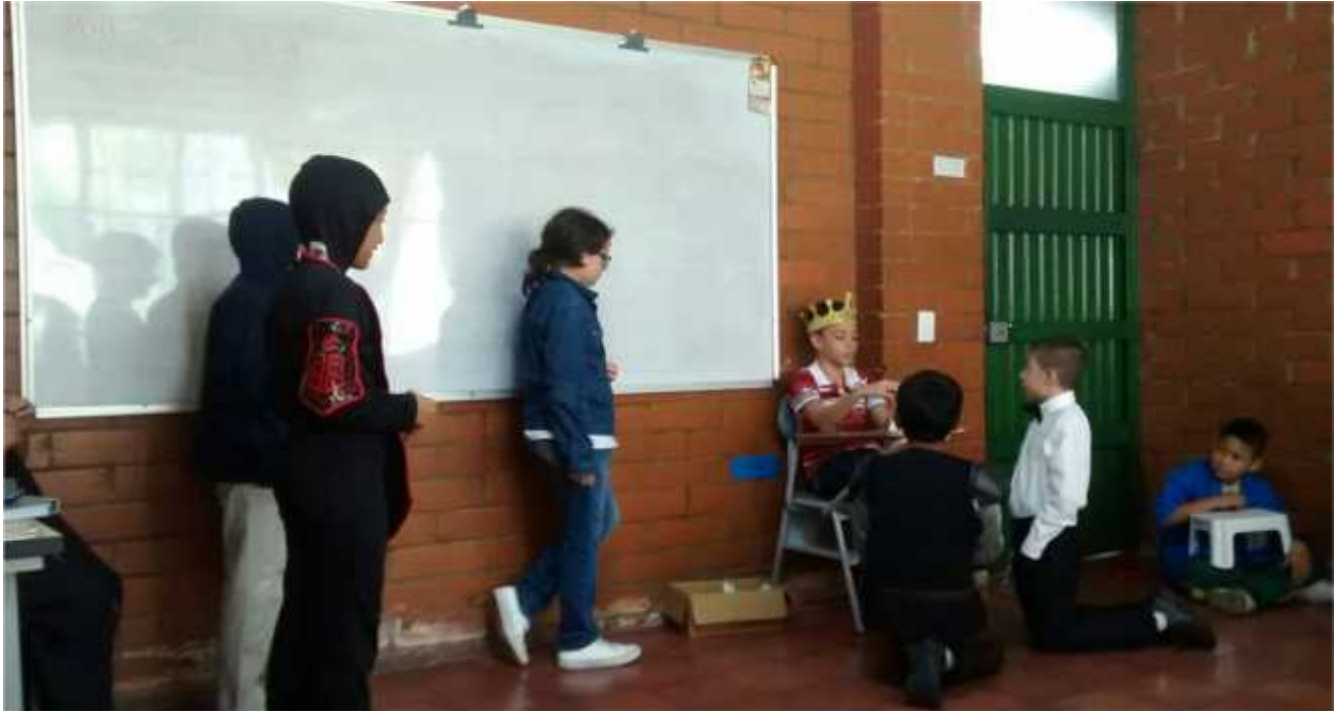
Anexo 6 obra de teatro Los caballeros de la Mesa Redonda Grupo 5.1.