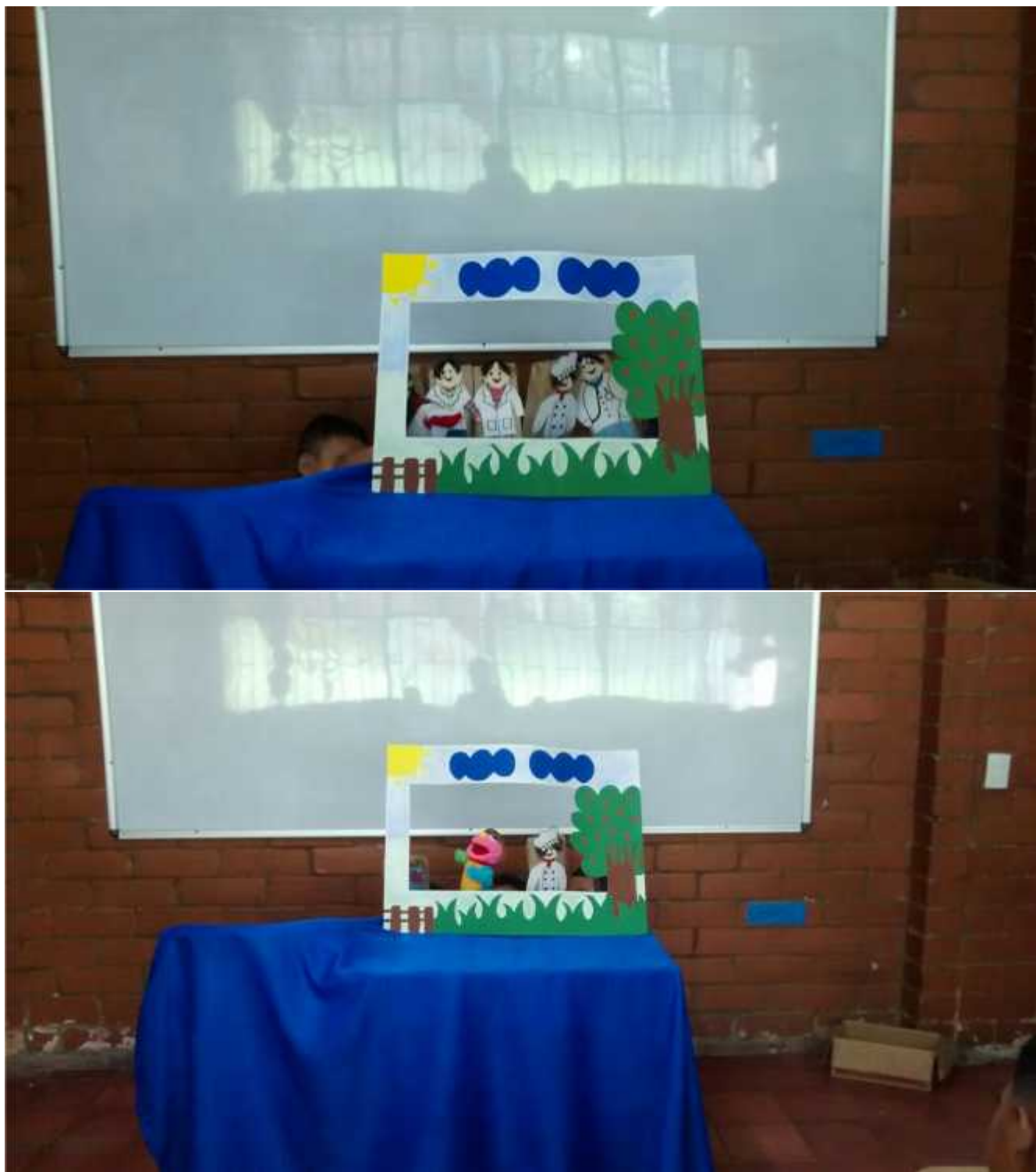
Anexo 8 obra de títeres El Panadero y sus Amigos. Grupo 3.2